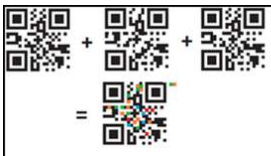
Figura 1: QR Code 3 Layers (USSUY; FARTO, 2016)

Em Layer Colored QR Code, várias cores podem ser utilizadas, proporcionando a expansão da capacidade de armazenamento de dados. Para a identificação da quantidade de cores e sobreposições realizadas durante o processo de leitura e decodificação, é acrescentado um mapa de cores ao lado da imagem gerada (Ussuy e Farto, 2016). Na Figura 1 é apresentada a abordagem proposta e desenvolvida.