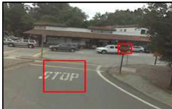
Figura 1 - PDI com placas e sinalização de pare

A plataforma proposta pode ser entendida como um ambiente para simulação de estradas inteligentes, onde o protótipo faz o uso de câmera e sensores de IoT para identificar sinais (placas) de trânsito por meio de Processamento Digital de Imagens (PDI). Na Figura 1 é apresentado um protótipo para detecção de sinalização de “pare”.